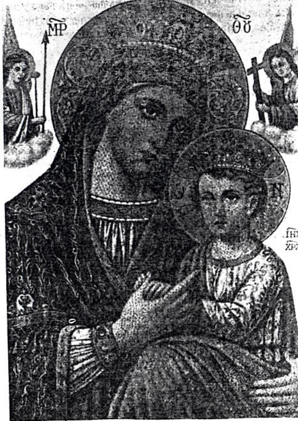
ወደ ታሪኩ መለስ ስንል እመቤታችን ድንግል ማርያም የብዕለት ረገ ሕዝቡም ተሰብስበው፡ ከአማካሪቸው በኋላ ምን ማድረግ እንደ

መቀላቀል እንደማይቻል፡ ከእመቤታችንም የልደት በዓል ጋር የሌላ አምልኮት ስም መጥራት ጉዳትን የሚያመጣ እንጅ ጠቃሚ አለመሆኑን መረዳት ይገባል አፈጻጸሙም በዛፍ ስር መሆኑ ቀርቶ በቤት ውስጥ ቢሆንና የእመቤታችንን ስም በመጥራት ብቻ ከሆነ አማላጅነቷ የማይለያቸው መሆኑ ግልጽ ነው = ልጅ እንደመሆኗ ሦስት ዓመት ሲሞላት እናትና አባቷ ወደ ቤተ መቅደስ ወስደው በዘመኑ ለነበረው ሊቀ ካህናት ዘክርያስ ስሙት ዘክርያስም ተቀብሎ ይህችን ከእናቷ ጠት ከወላጅቿ ቤት መለየት የማትችል ሕፃን ተቀብሮ ምን እመግባታለሁ የትስ አስቀምጧታለሁ በማለት ግራ ስለገባው ደወል ደውሎ ሕዝቡ እንዲሰበሰቡ አደሚሻል ሲያወጡና ሲያወርዱ ላሉ፡ መልእክት ቅዱስ ፋኑኤል ገብስት ሰማያዊ ዕዋዕ ሰማያዊ ይህ ወርዶ መግባት አርጓል ሕዝቡም የምግብ ነገር ከተያዘ ወደቤተ መቅደስ ገብታ እንድትቀመጥ ተሰማምተው ተበትነዋል = ዘክርያስም ሕፃኗን ተቀብሎ ወደቤተ መቅደስ አስገብቷታል = በዚህም መላእክት እየመገቡ ጥና እያጽናኑዋት ፲፪ ዓመት ሙሉ ኖራለች = በወላጅቿ ቤት ፫ ዓመት ከኖረችው ጋር የ፲፮ ዓመት ልጅ ስለሆነች ለአካለ መጠን ደርሳለችና ቤተ መቅደሳችንን ታስዶ ፍራሎች ትውጣልን በማለት እይሁድ ተነግሰተው ዘክርያስን ስላስቸገሩት እርሱም ምን ማድረግ እንደሚቻል በሃብብ ላይ ሳለ ከእግዚአብሔር የታዘዘ መልእክት በራዕይ ተገልጿል፡ ከነገሩ እምራሌል ሚስቶቻቸው የሞቱባቸውን ወንዶች ብትር ሰብስብና ከቤተ መቅደስ አስገብተህ ስትጸልይበት እድር አለው = ዘክርያስም መልእክት እንዳዘዘው አድርጎ በማግሥቱ ቢያወጣው በየሴፍ በትር ላይ .. እየሴፍ ዕቀባ ለማርያም የሚላ ተጽፎ ተገኝቷል ፪ኛው ለርግብ ወርዶ ከራሱ ላይ አርፋለች ፫ኛው እጣ ቢጣጣሉ ለእርሱ ወጥቷል ከዚህም በኋላ የሴፍ ወደቤተ መቅደስ እንዲያስተምጣት ተወስኗል = በየሴፍ ቤትም እንዳለች መልእክት ቅዱስ ገብርኤል ተልኮ ፀጋን የተመላሽ ሆኖ ደስ ይበልሽ እግዚአብሔር ከአንቺ ጋር ነው ከሴቶች ሁሉ ተለይተሽ እንቺ የተባረከሽ ነሽ የማግሰንሽም ፍሬ የተባረከ ነው ሉቃ ፩፡ ፳፮፡ ፳፭ ማለት በድኅንግልና ጸንሳ በድንግልና ጌታ