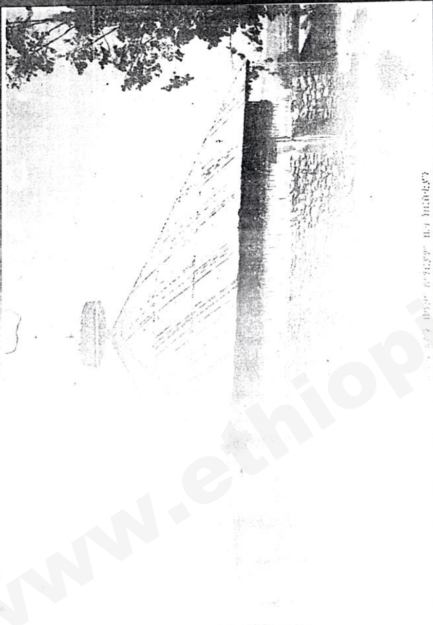
የታሪካዊ ጳጳሳዊ ቤተ ክርስቲያን